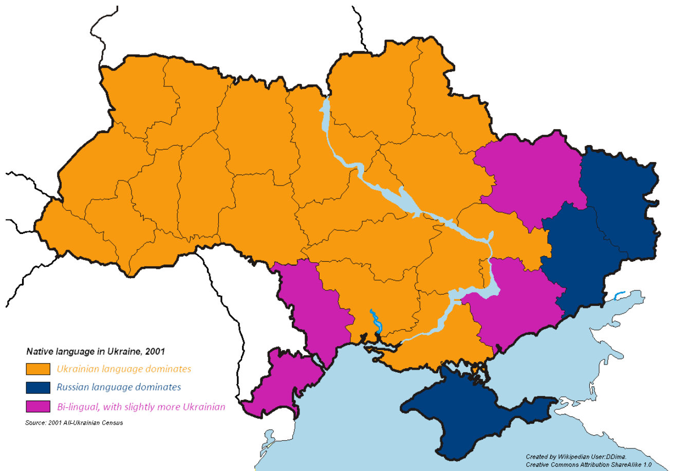
Мапа розподілу населення за рідними мовами в Україні, 2001. Автор: Дмитро Сергієнко